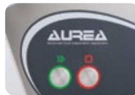
Comandi inox a filo macchina Thin stainless steel buttons