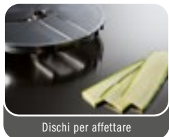
Dischi per affettare