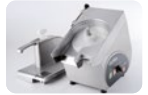
Rapido montaggio Rapidly disassembled