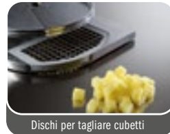
Dischi per tagliare cubetti Discs to cut in cubes