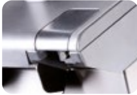
Doppia sicurezza micro Twin micro safety