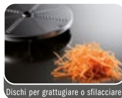
Dischi per grattugiare o sfilacciare