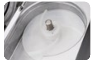
Facile Pulizia Simple washing