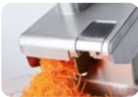
TV100 e TV150 con speciale convogliatore in acciaio inox ideale per alimenti molto umidi