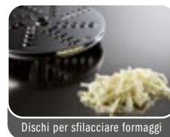
Dischi per sfilacciare formaggi