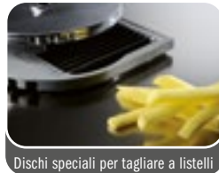
Dischi speciali per tagliare a listelli Special discs to cut in strings