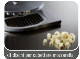
kit dischi per cubettare mozzarella Discs to shred and dice mozzarella