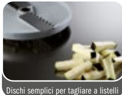
Dischi semplici per tagliare a listelli Simple discs to cut in strings