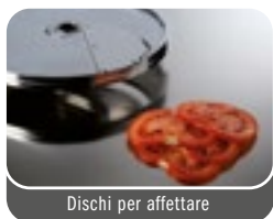
Dischi per affettare