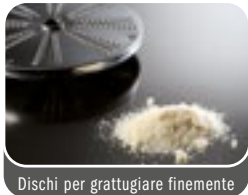
Dischi per grattugiare finemente Fine grater discs