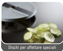
Dischi per affettare speciali